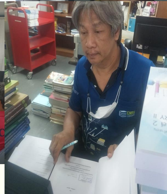
CMRUL : Collection Development and Classification